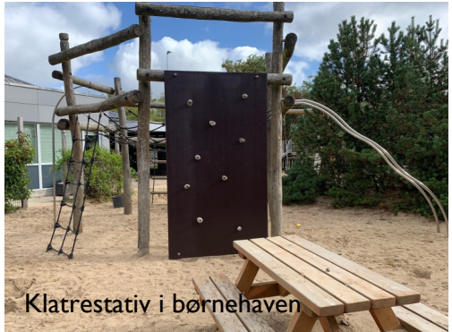
Klatrestativ i børnehaven