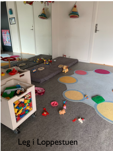
Leg i Loppestuen