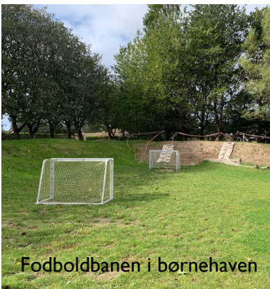
Fodbolddbanen i børnehaven