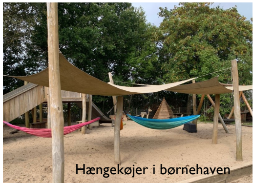
Hængeskøjler i børnehaven

Det er derfor meget vigtigt, at I holder institutionen opdateret med jeres aktuelle telefonnumre – på Aula og til personalet.