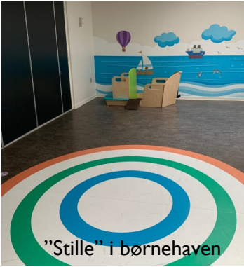
"Stille" i børnehaven