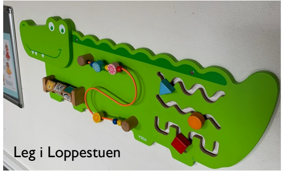
Leg i Loppestuen